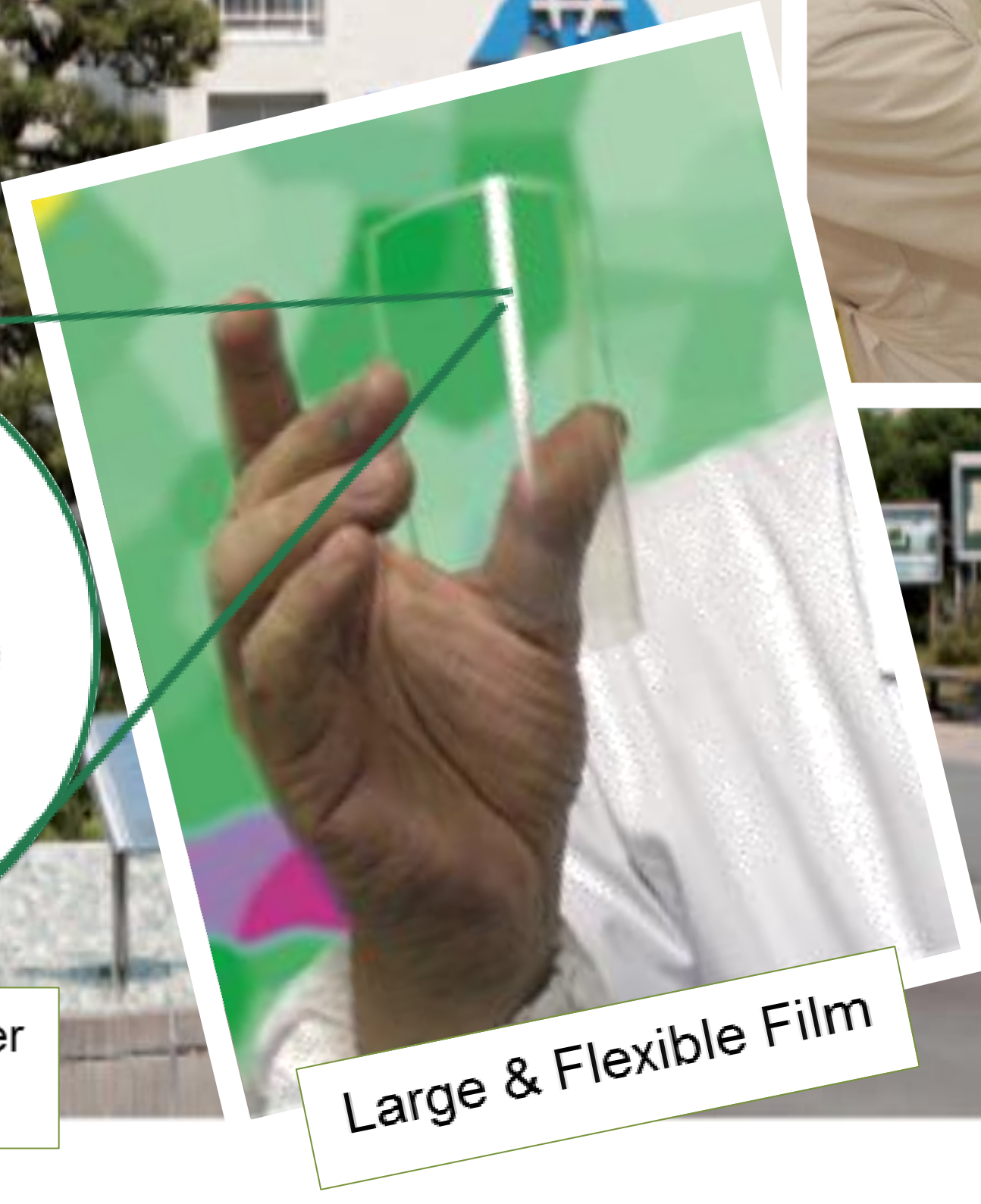
Large & Flexible Film