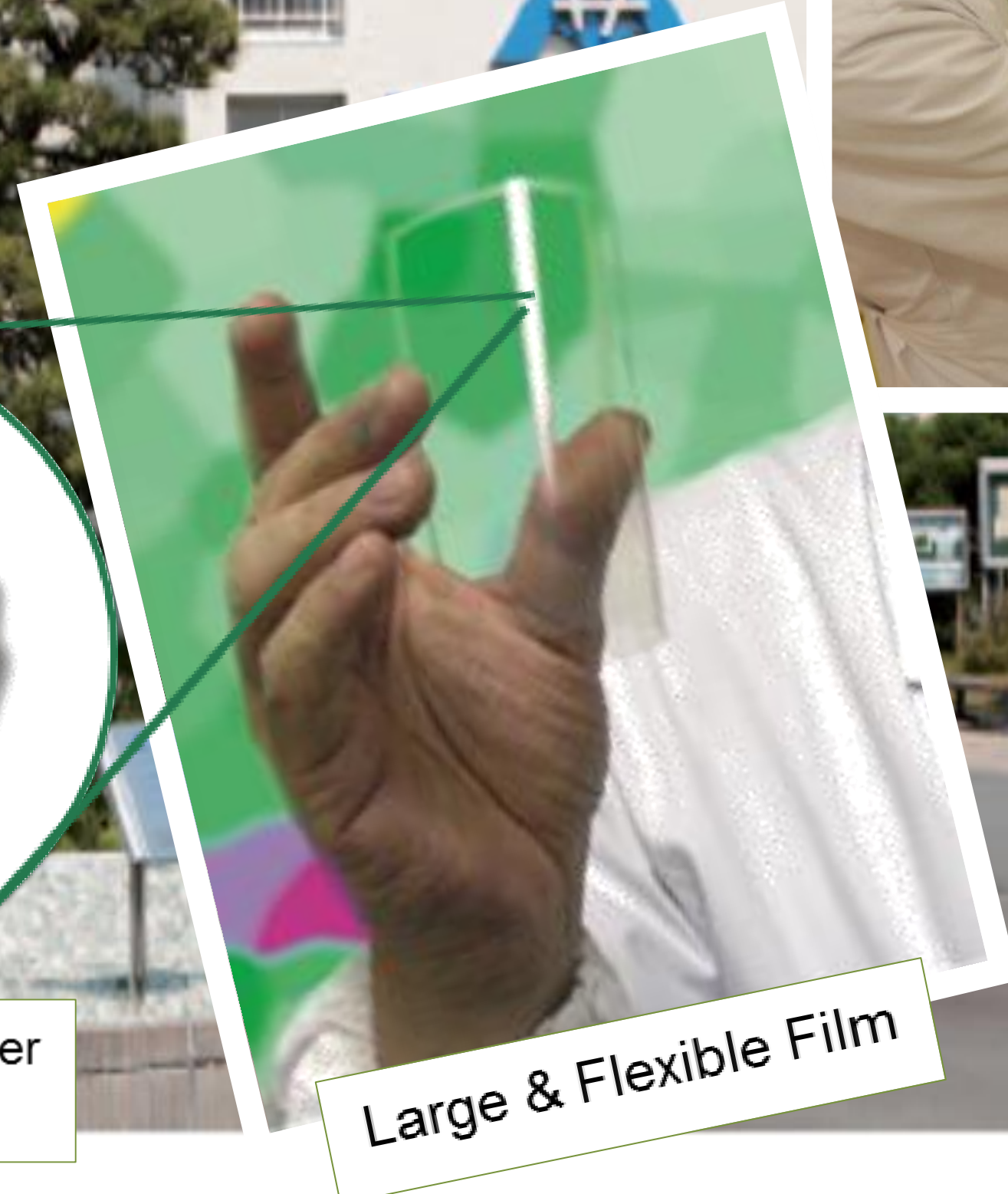
Large & Flexible Film