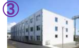
③ 秀峰寮 (国際寮)