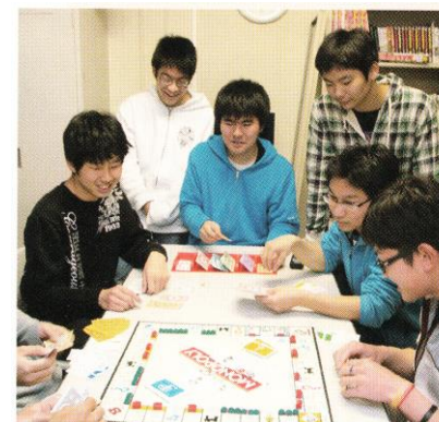
談話室でのひととき