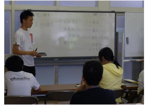
マテカ(上級生による学習支援)