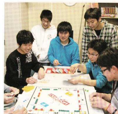
談話室でのひととき