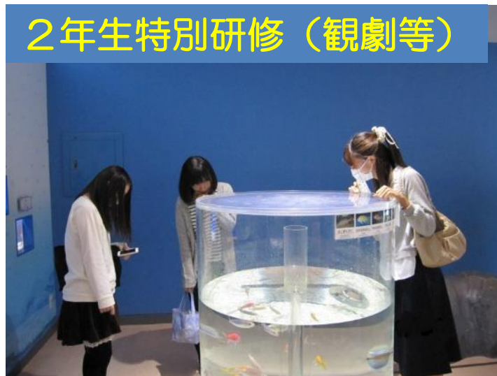
2年生特別研修 (観劇等)