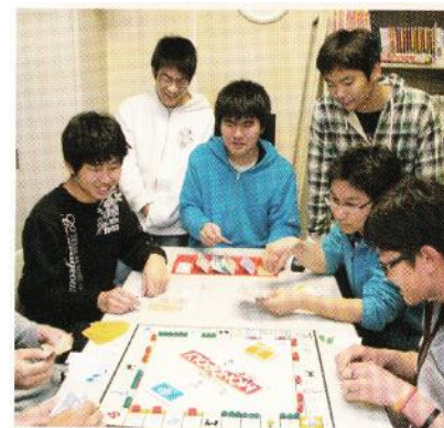
談話室でのひととき