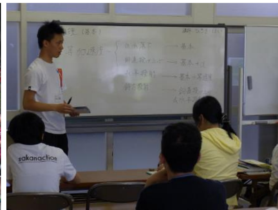
マテカ(上級生による学習支援)