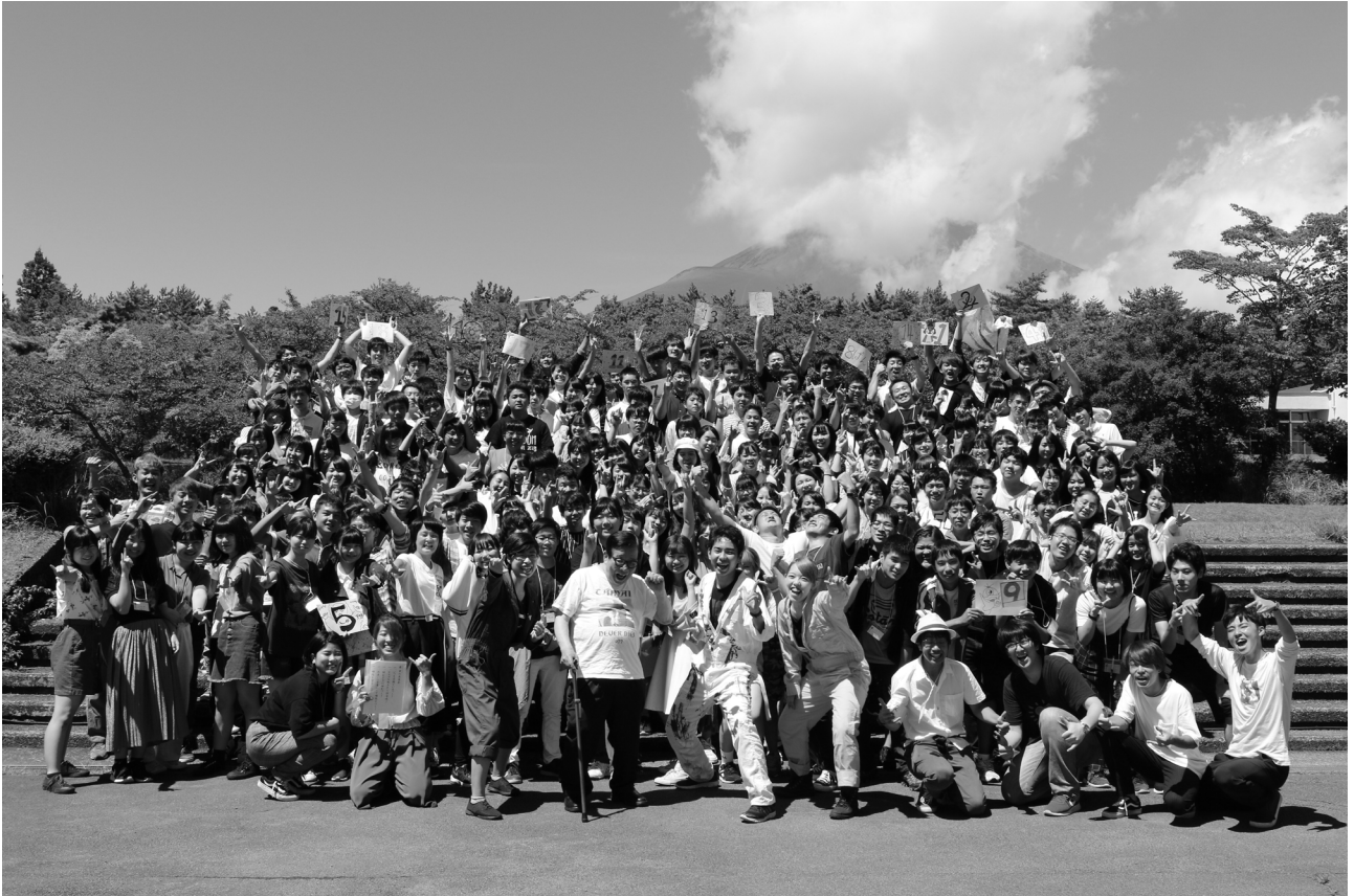
静岡県・中央のつどい

毎年夏休みに「つどい」という合宿行事を実施しています。高校奨学生の「つどい」は2泊3日の日程で、全国8会場で開催。大学・専門学校奨学生の初年度採用者を1か所に集めて行う「つどい」は4泊5日の日程で開催。有意義な学生生活を送るためにどうするかを考えてもらうため、卒業生や社会で活躍する著名人、海外の若者など多様な人材も招き、様々な刺激に触れる機会をつくっています。参加者の多くは「つどい」で夢を見つけ、一生の仲間を得たと言い、参加満足度は9割を超えています。