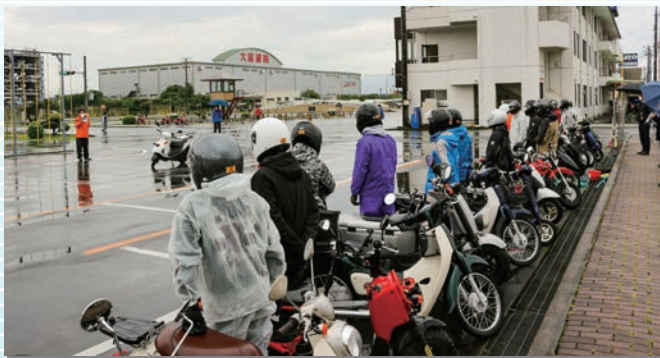
原付安全運転講習会